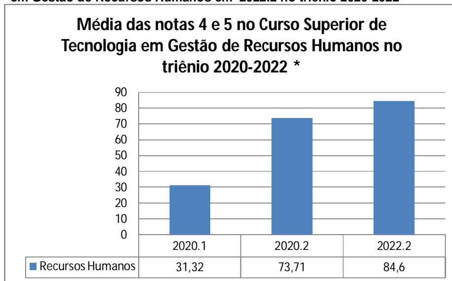
Gráfico 3: Média das notas 4 e 5 obtidas no Curso Superior de Tecnologia em Gestão de Recursos Humanos em 2022.2 no triênio 2020-2022