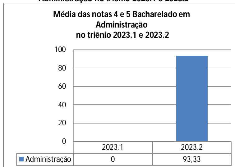
Gráfico 3: Média das notas 4 e 5 obtidas no Bacharelado em Administração no triênio 2023.1 e 2023.2